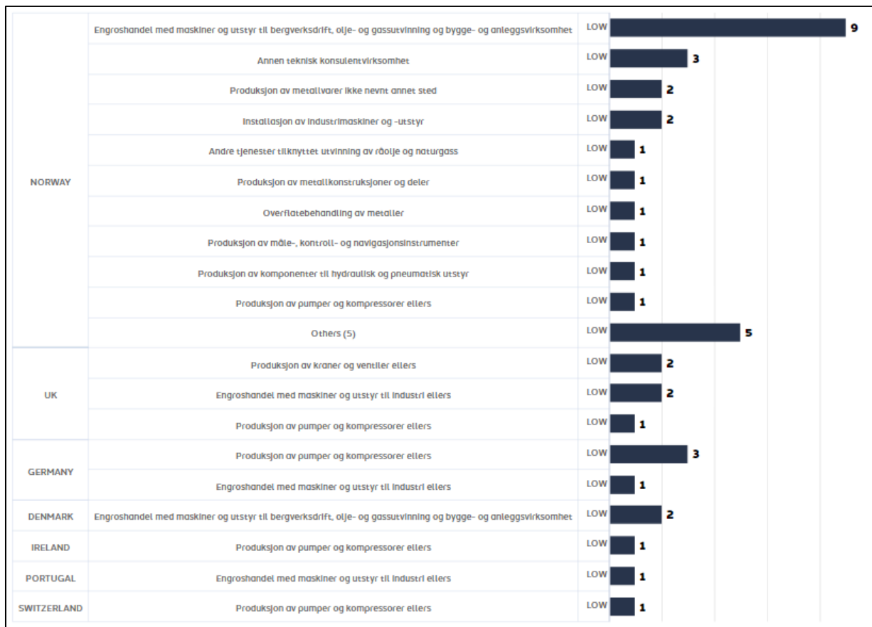
Figur 3: Antall leverandør- K. LUND vurdering